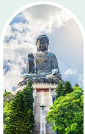
พระใหญ่โป่หลิน