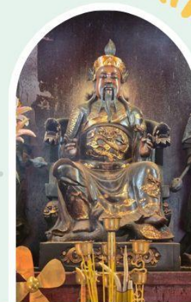
วัดปักไต