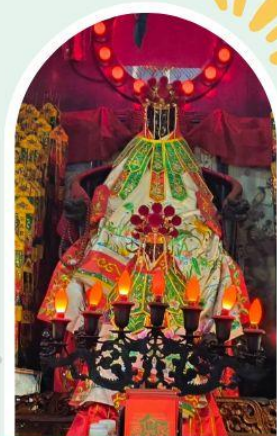
วัดเจ้าแม่กวนอิมฮ่องอ่ำ