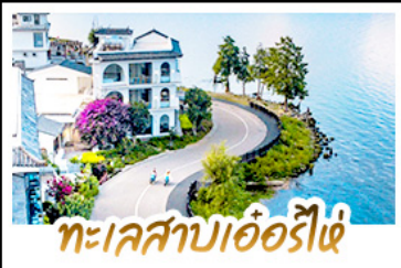
ทะเลสาบเอ๋อร์ไห่