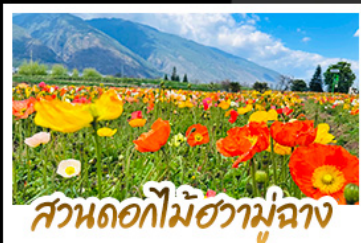
สวนดอกไม้ฮวามู่ฉาง