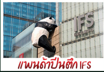
แพนด้าป็นตัก IFS

พระพุทธรูปเล่อซาน - จินฝอซาน - รถไฟฟ้าทะลุคัง อู่หลง - แพนด้าป็นตัก IFS