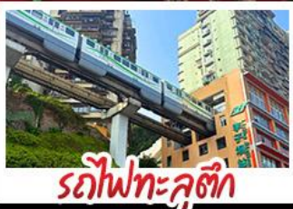
รถไฟทะลุคัง