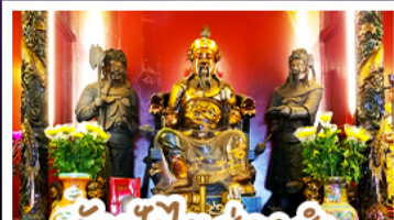
วัดปิ้งไต้ฮงอ่า

นั่งกระเช้าเองปิงสักการะพระใหญ่เทียนถาน • ขอพรองค์แซง โชคลาภ การเงินและธุรกิจ เทพเจ้าปิ้งไต้ฮงอ่า ขอพรเรื่องความสำเร็จในชีวิตและการทำงาน • วัดหวังต้าเซียน สักการะ-สิ่งศักดิ์สิทธิ์ เสริมมงคลชีวิต • เจ้าแม่กวนอิมฮงอ่า ขอเรื่องเงิน ทรัพย์สิน และความมั่งคั่ง • อิศระ-ท่องเที่ยว 2 วัน เลือกซื้อบัตรคัสซีนีแพลนคหรือซ้อปปิ้งใจ