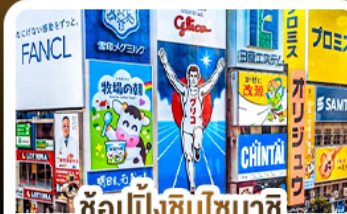
ซ้อปั้งชินโซบาชิ และโดตงโมริ