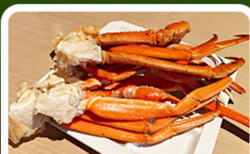
เมนูพิเศษ! ขาปู