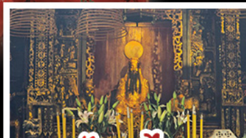
วัดกวนหนี่ท