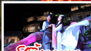
ชีวิตจิ้งจอกขาว