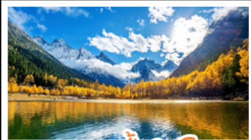
อุทยานป่าผิงโกว