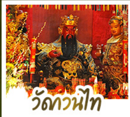
วัดกวนหน้้ท