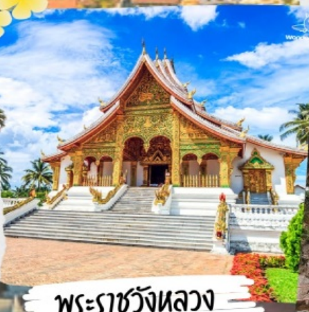
พระราชวังหลวง