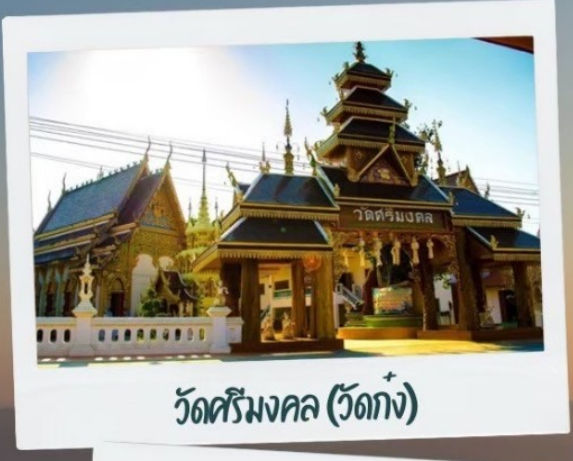
วัดศรีมงคล (วัดก้ง)