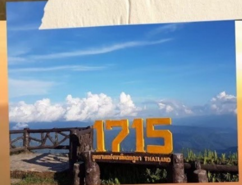
จุดชมวิวกว 1715