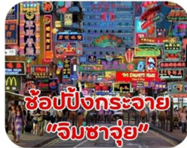
ช้อปปิ้งกระจาย "จิมซาจุ่ย"