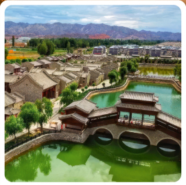
หมู่บ้านตันซี้ซื่อ