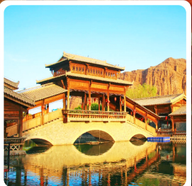
เมืองเล็กต้นเสียวโซ่ว