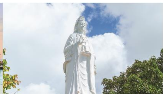
วัดลินห์อึ้ง