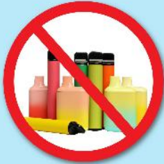
ปืนไฟฟ้า บุหรี่ปั้วไฟฟ้า