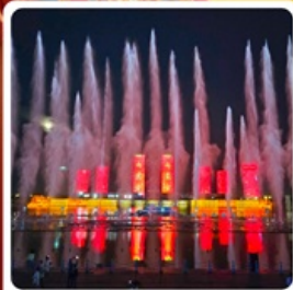
น้ำพุคังปาสี

● โอโหล้ เป็นทรายเสียงชาวนา แหล่งท่องเที่ยวระดับ 5A ของจีน ภูเขาไฟอุลันฮาตา น้ำพุคังปาสี น้ำพุที่สูงที่สุดในเอเชีย