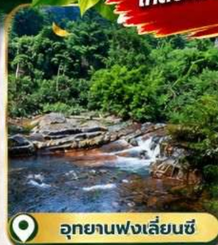
อุทยานฟ่งเลี่ยนซี