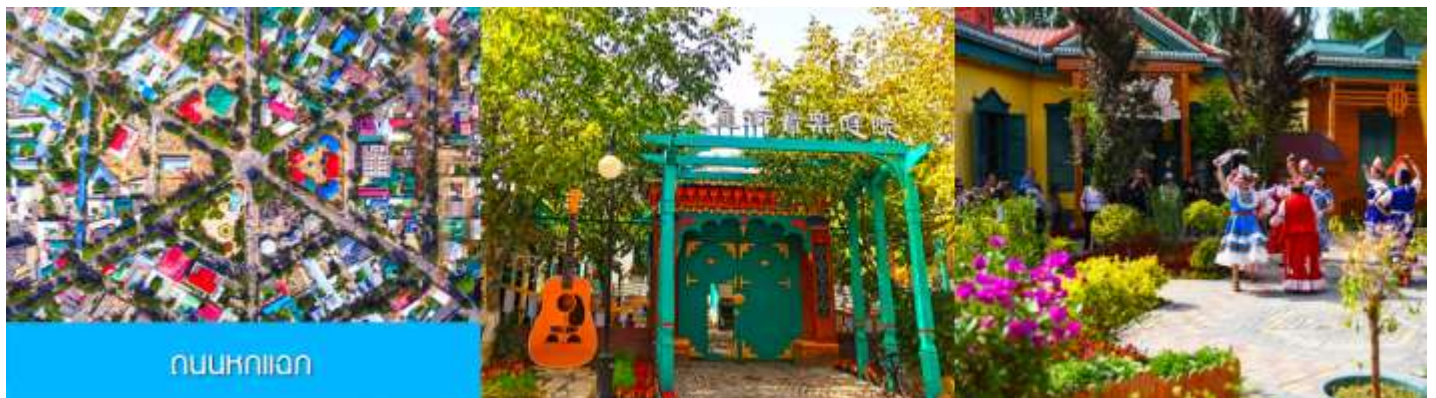
ถนนหกโลก

จากนั้นนำท่านเดินทางสู่ เมืองอิหนิง 伊宁 (ระยะทาง 200 กม. ใช้เวลาเดินทางราว 3 ชั่วโมง)