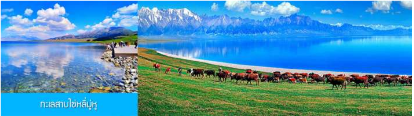
ทะเลสาบไซหลี่มู่หู

พักที่ XIHAI LIJING HOTEL ระดับ 4 ดาวท้องถิ่นหรือเทียบเท่าในเมืองบัวเล่อ