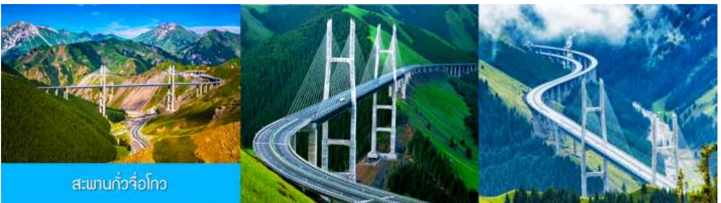
สะพานกั๋วจื่อโกว

หลังอาหารนำท่านเดินทางโดยรถบัสสู่ ตำบลนำลาถิ 那拉提 (ระยะทาง 300 กม. ใช้เวลาเดินทางราว 4 ชั่วโมง)