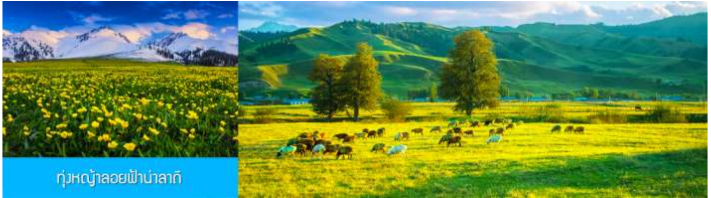
ทุ่งหญ้าลวยฟ้านาลาตี

พักที่ WAN SEN HOTEL ระดับ 4 ดาวท้องถิ่นในตำบลนาลาตี