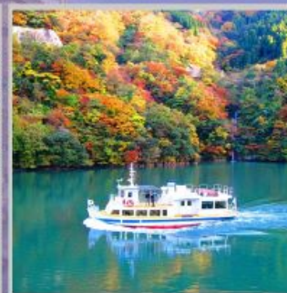
“SHOGAWA YURAN CRUISE”