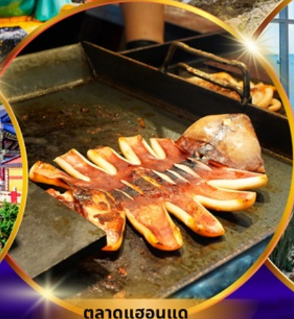
ตลาดแฮอนแด