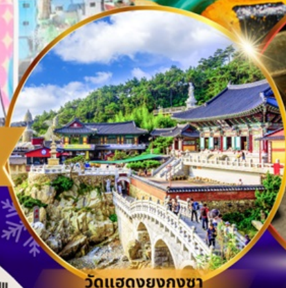
วัดแฮดงยงกุงซา