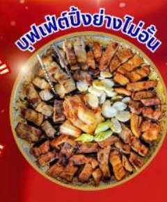
บุฟเฟ่ต์ปิ้งย่างไม่วัน