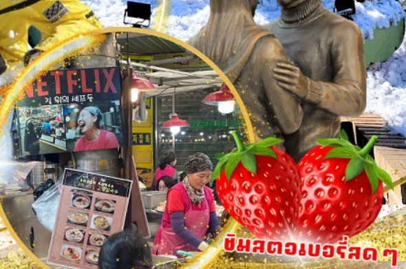
ตลาดกวางจง