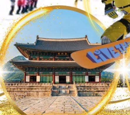
พระราชวังเคียงบกกรุง