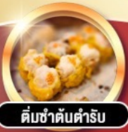
ติ่มช่าต้นตำรับ