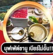
บุฟเฟ่ต์ชาบู เมื่อรโมอื่น!!