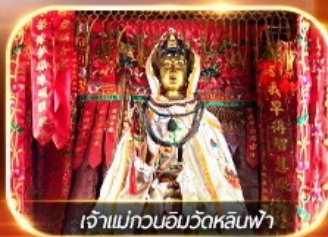
เจ้าแม่กวนอิมวัดหลินฟ้า