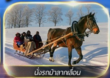
นั่งรถม้าลากเลื่อน

พักหมู่บ้านหิมะ ชมแสงสียามค่ำคืน ฟรีนังรถม้าลากเลื่อน