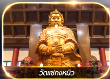
วัดเชกงหวม