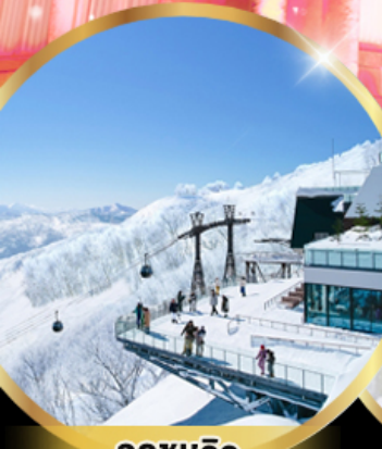
จุดชมวิว Unkai Terrace