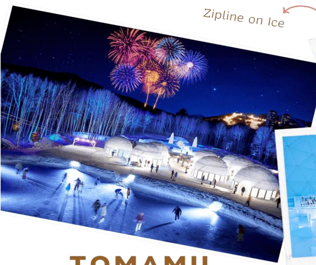
Zipline on Ice

ระยะทางประมาณ 60 เมตร ระหว่างทางคุณจะได้ชื่นชมทิวทัศน์ของหิมะ และลานน้ำแข็งที่น่าอัศจรรย์ Ice Bakery & Cafe คาเฟ่ที่ให้บริการเครื่องดื่มร้อน และขนม ที่ให้ท่านนั่งทานบนโต๊ะและเก้าอี้น้ำแข็ง Ice Bar บาร์ที่บริการเครื่องดื่มประเภทค็อกเทล และเครื่องดื่มแอลกอฮอล์อื่นๆ หลายชนิด ที่เสิร์ฟใน แก้วน้ำแข็งสวย ๆ เป็นต้น (**ราคาทัวร์ไม่รวมค่ากิจกรรมและค่าเครื่องดื่ม Ice Bar, Ice Bakery&Cafe**)