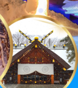
ศาลเจ้า ออกโทโต