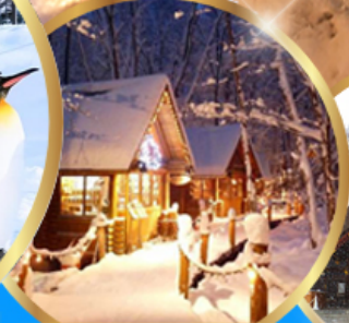
หมู่บ้านเทพนิยาย นิงเกิลทอเรส