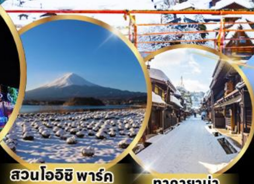
สวนโออิชิ พาร์ค