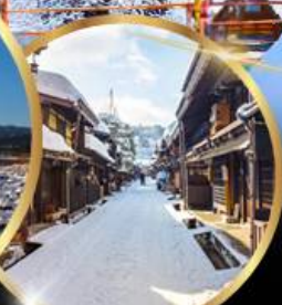
ตากายาม่า