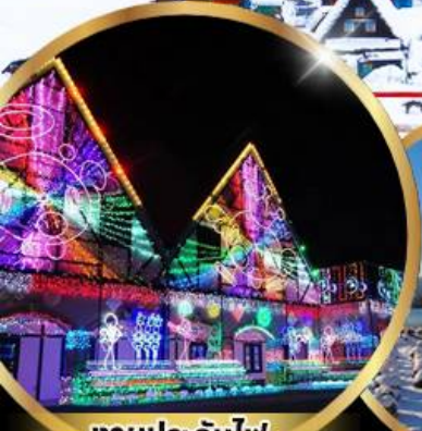
งานประดับไฟ