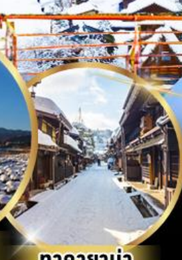
ทาคายาม่า