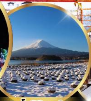
สวนโออิชิ พาร์ค