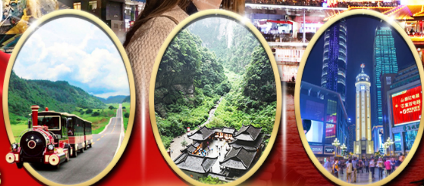
อุทยานหลุมฟ้า สะพานสวรรค์ อุทยานเขานางฟ้า ถนนคนเดินเจียฟางเป่ย์