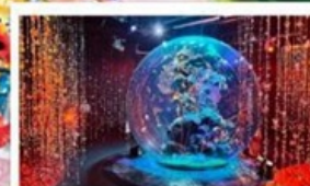
Aquarium โทเบ อะโตอา

📦 โหลด 23 KG. x2 ( รวม 46 KG. ) ทั้งไป - กลับ