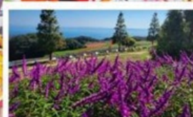
ชมทุ่ง "ดอกบลูซิลเวีย"