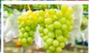
เก็บองุ่นไซน์มิสแคตสด ๆ

🇯🇵 เอเชียโทเคะ - โอซาก้า (รวมบัตรเข้าสวนสนุก USJ)