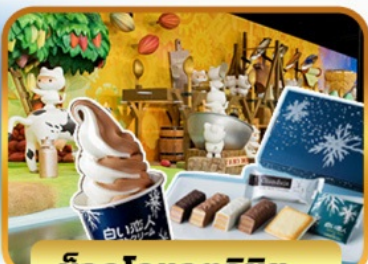
ช็อกโกแลตชิช: