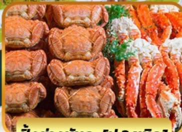
บั้งย่างมันตะ [ปู 3 ชนิด]