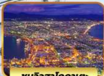
ชมวิวฮาโกดาเตะ