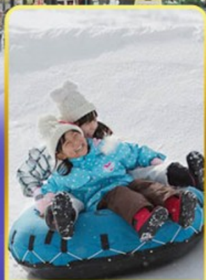
กิจกรรม น ลานสกี