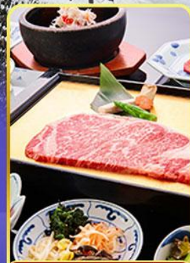
ROKKASEN ฟรีเมียม