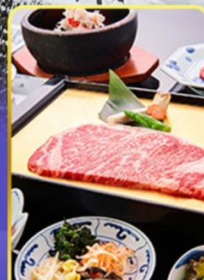
ROKKASEN พรีเมียม