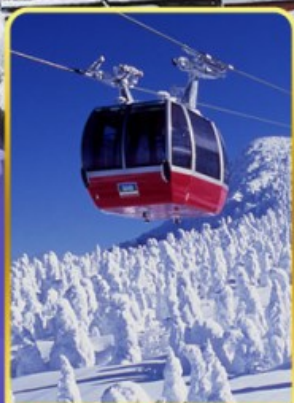
นั่งกระเช้าขึ้นเขาซาโอะ