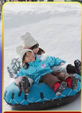
กิจกรรม ณ ลานสกี