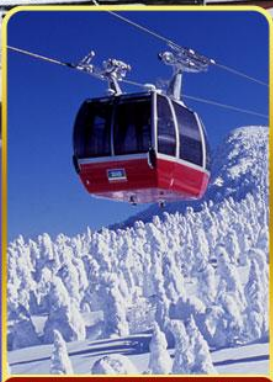
นั่งกระเช้าขึ้นเขาซาโอะ