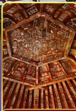
วัดซาชะเอโดะ