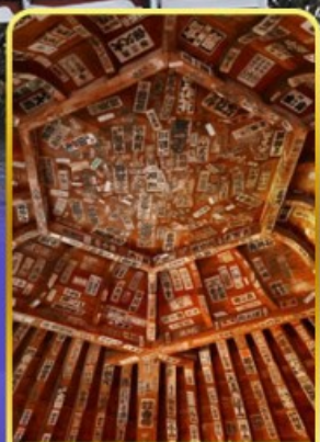
วัดซาเซเอโดะ