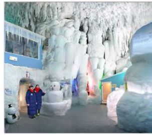
พิพิธภัณฑน์น้ำแข็ง