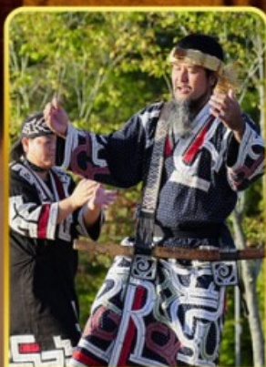
พิพิธภัณฑ์โอนู