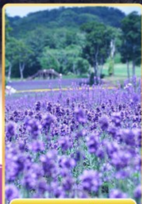
ทุ่งลาเวนเดอร์ทัมบาระ