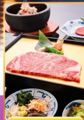
บุฟเฟ่ต์ ROKKASEN