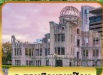
อะตอมมิคคอมมูนิตี้มอลล์