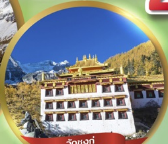
วัดชงกู่ CHONG GU