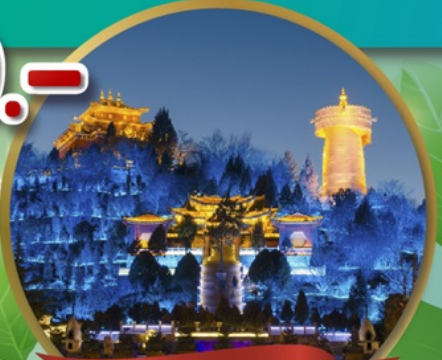
เมืองโบราณแซงกรีล่า