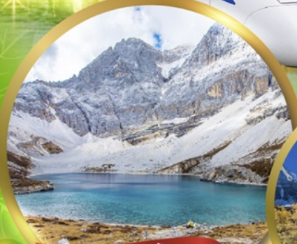
ทะเลสาบน้ำนม MILK LAKE