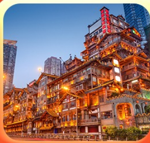
“ล่องเรือชมฉางหยาดัง”