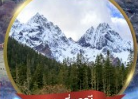
ภูเขาสี่ฤดู