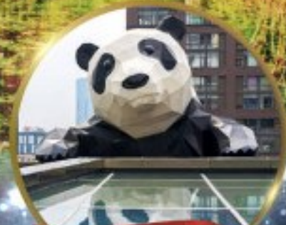
แพนด้ายักษ์

มหัศจรรย์ความงาม อุทยานจิวจ้ายโกว (รวมรถเหมาเที่ยวอุทยานเต็มวัน) ชมอุทยานหวงหลง (รวมกระเช้า) • สี่ฤดู • อุทยานของเขี้ยวโกว (รวมรถอุทยาน) เมืองเก่าชงพาน • ถนนคนเดินจิมหลี่ + ไถ่ตู้หลี่ • ชมแพนด้ายักษ์ป็นตึก