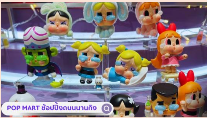
POP MART ซ้อปบังคับบนบานกิ้ง