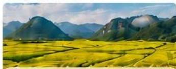
พิก TONG CE HOTEL เทียบเท่า 4 ดาว Local