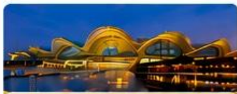
พิก FEI XING HOTEL เทียบเท่า 4 ดาว Local