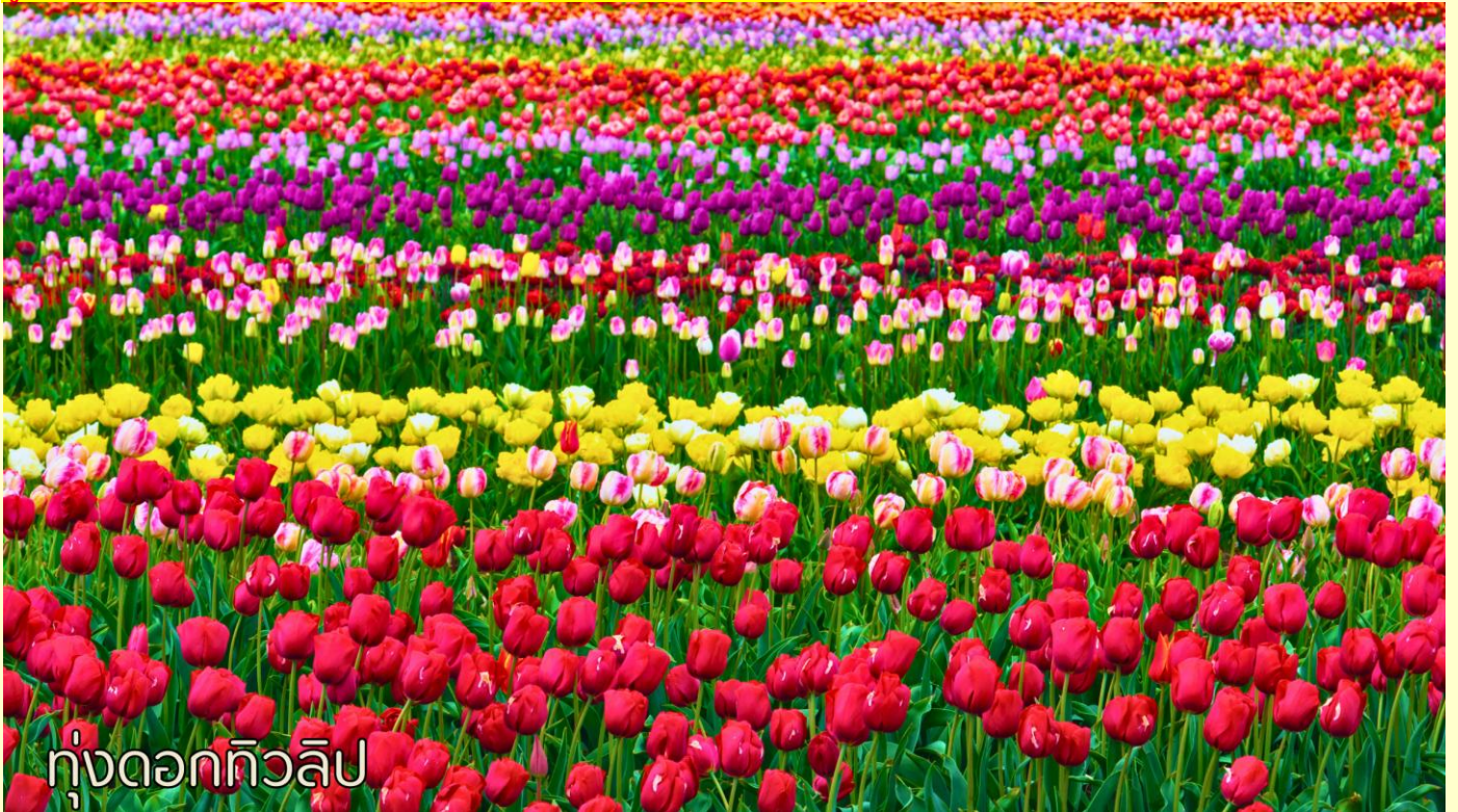
ทุ่งดอกทิวลิป

**หมายเหตุ: หากโปรแกรมดอกไม้ ณ วันเดินทางท่องเที่ยวยังไม่บานหรือร่วงหล่น ทั้งนี้ขึ้นอยู่กับสภาพภูมิอากาศของภูมิภาค ทางบริษัทไม่สามารถประกันและกำหนดการบานของดอกไม้ได้**