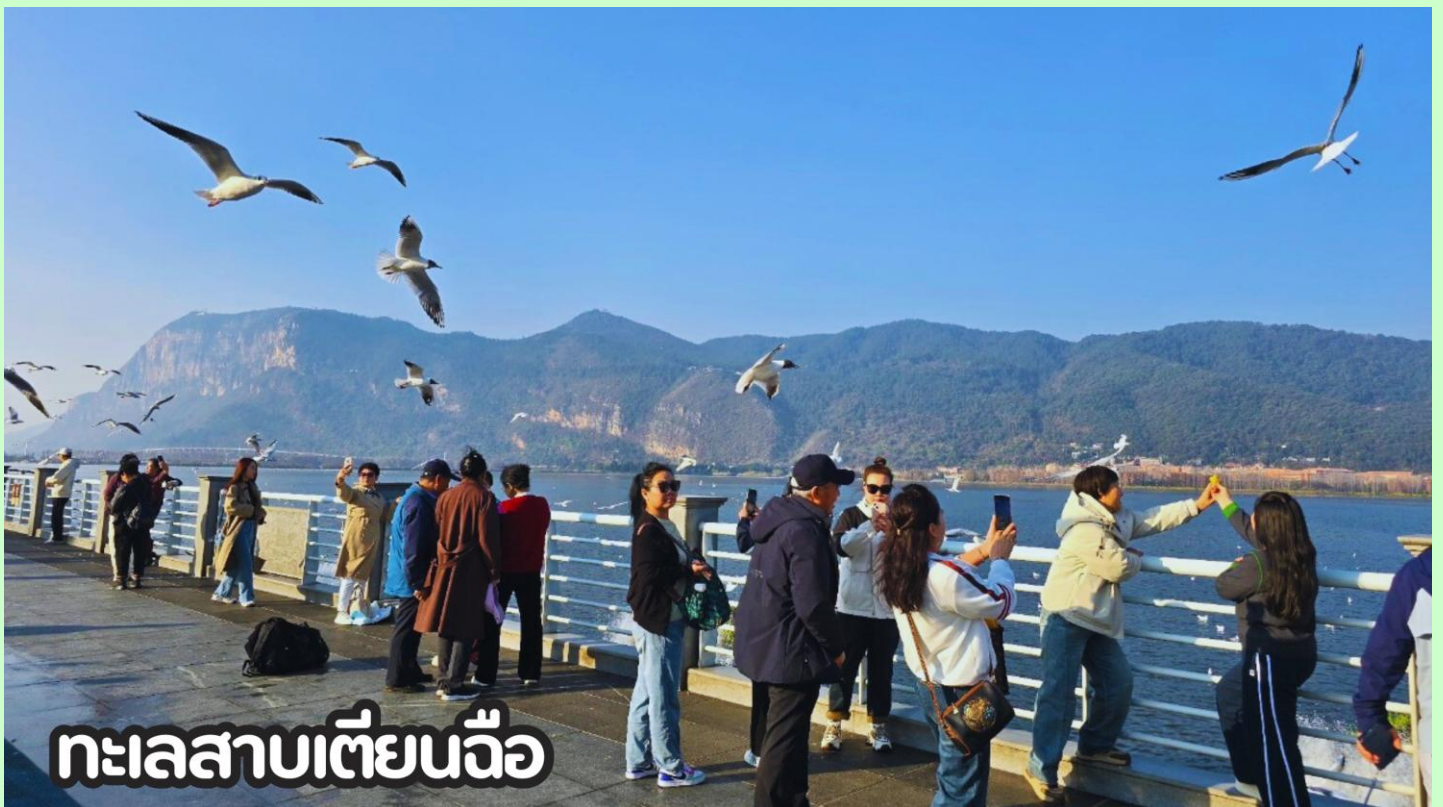
ทะเลสาบเตียนฉือ

**สำหรับท่านที่ไม่ต้องการซื้อออฟชั่นเสริม สามารถอิสระช้อปปิ้งที่ถนนคนเดินใกล้เคียงกันได้**