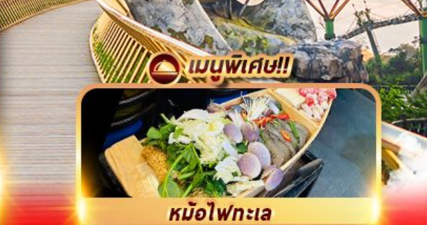
หม้อไฟทะเล