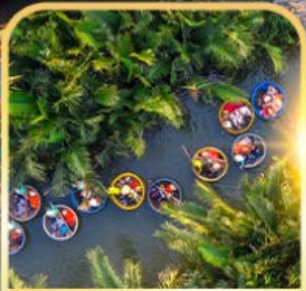
น้ำร้อนกระดัง