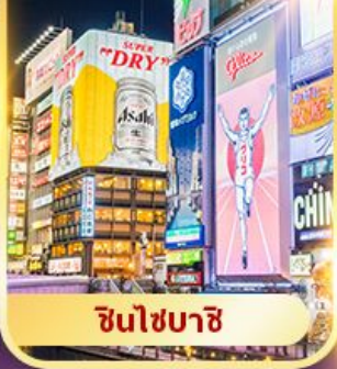
ชินไซบาชิ