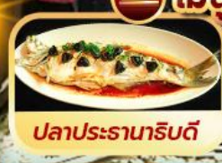
ปลาประธาราธิบดี