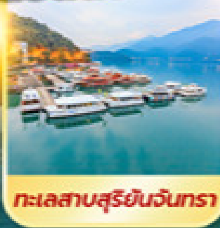
ทะเลสาบสุรียินจันตรา