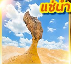
อุทยานเหย่หลิว

เที่ยวเต็ม!! 14 วัน 10 คืน แนะนำในห้องพักส่วนตัว