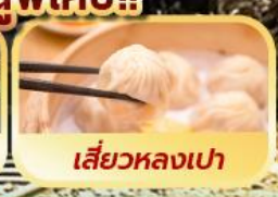
เสี่ยวหลงเปา