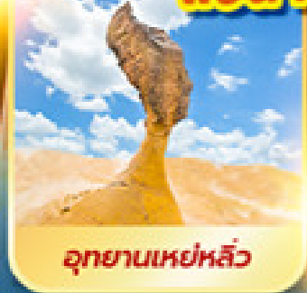
อุทยานเหย่หลิว

เที่ยวเต็ม!! ไม่มีวันอิสระ แช่น้ำแร่ในห้องพักส่วนตัว