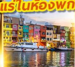
หมู่บ้านประมงเจิ้งปิน